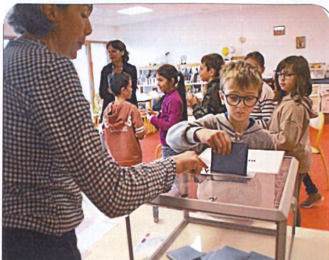
Les nouveaux élus au CME, désignés par les écoliers de 6 à 11 ans vont siéger au mois de janvier