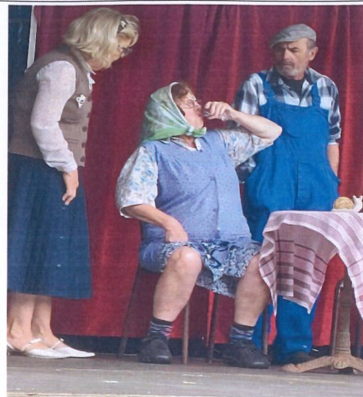
La troupe de théâtre de PSG « Les balladins délurés » lors du Festival au pré - Chapelle Saint-Germain - septembre 2023. »