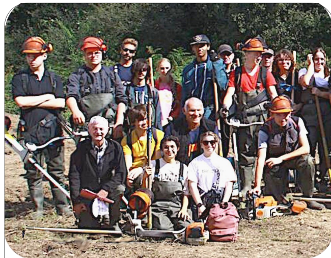
Le 20 septembre, les bénévoles de l'AARDEUR ont travaillé, avec 23 lycéens de Kerbernez de Plomelin, au Moulin de Trévan.