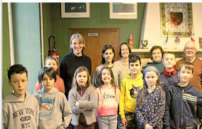
Première réunion des nouveaux élus du Conseil Municipal des Enfants, le 18 janvier (Article ci-dessous et crédit photos Laurence Prime)