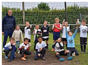
Les U9 de Plogastel.

U8-U9 : pas de classement, que des vainqueurs.