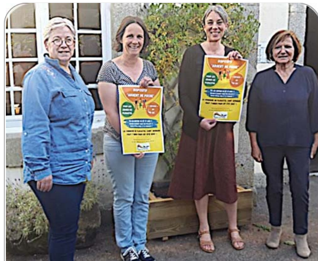
Lancement du dispositif « Argent de Poche »