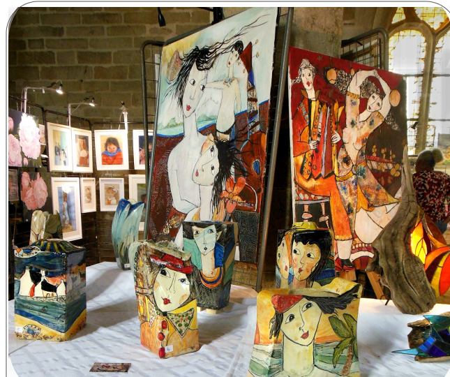
Exposition à la Chapelle Saint-Germain - Aout 2023. »