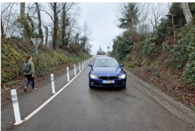
ILLUSTRATION DE L'AMÉNAGEMENT PROPOSÉ